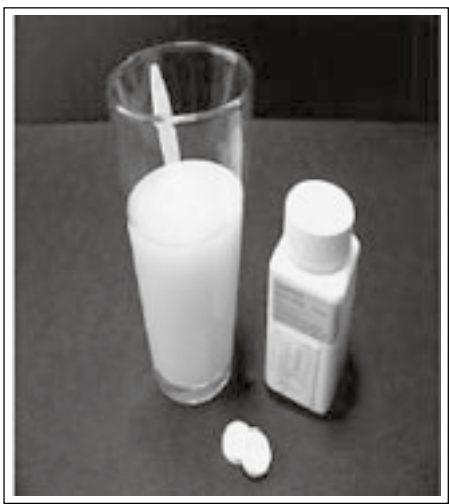
ยาเอ็กเจด (Exjade)

3. ยาขับธาตุเหล็กที่เป็นมาตรฐานคือ ยาเดสเฟอราล ใช้ฉีดเข้าใต้ผิวหนังโดยใช้เข็มฉีดยา ราคาขวดละประมาณ 200-250 บาท สำหรับยาเม็ดมี 2 ชนิด คือ ดีเฟอริโพรน (ขนาด 500 ม.ก. ต่อเม็ด) ราคาเม็ดละประมาณ 30 - 75 บาท ส่วน ยาดีเฟอราซีร็อกซ์หรือเอ็กเจด ซึ่งกำลังอยู่ในขั้นตอนการวิจัยน่าจะมีส่วนจำหน่ายอีกประมาณ 6 เดือน ราคาสูงกว่าดีเฟอริโพรน รายละเอียดของยาขับเหล็กหาอ่านได้จาก จุลสารฯ ปีที่ 15 ฉบับที่ 1 (ม.ค. - เม.ย.49) หน้าที่ 11-13