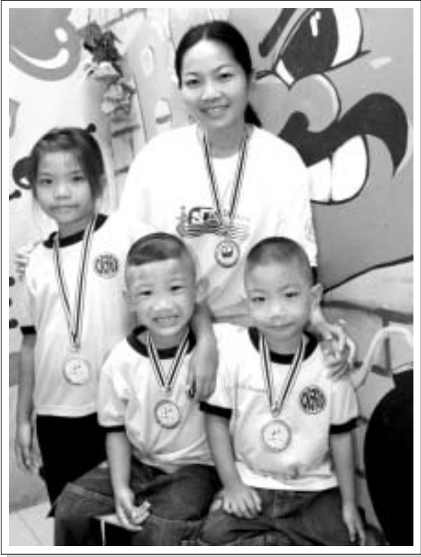
“ พลาสมาที่แข็งแรงเป็นสิ่งซึ่งทุกคนแสวงหา ด้วยรูปแบบที่แตกต่างไม่มีใครจ่ายราคานี้เท่ากันเลย ”

หลังจากที่น้อง Guide ได้รับการวินิจฉัยจากคณะแพทยศาสตร์ศิริราชพยาบาลว่าเป็นโรคธาลัสซีเมียและจะให้การรักษาโดยการปลูกถ่ายไขกระดูกคุณพ่อ คุณแม่และครอบครัวต่างพากันให้กำลังใจดวงใจน้อย ๆ ดวงนี้ สำหรับคุณแม่เองตลอดระยะเวลาที่ผ่านมาซึ่งมีความหวังกับการปฏิบัติทางการแพทย์ในยุคปัจจุบันว่าจะสามารถทำให้สุขภาพของลูกรักแข็งแรงได้ ก่อนเข้ารับการรักษาด้วยการปลูกถ่ายไขกระดูกนั้น คุณแม่จะระวังและป้องกันภาวะโรคแทรกซ้อนโดยจะถามผลของแพทย์ตลอดว่ามีภาวะซีดแค่ไหน ระวังระวังเรื่องการติดเชื้อ ตรวจเช็คผลแทรกซ้อนต่างๆ ที่อาจเกิดขึ้นได้จากโรคธาลัสซีเมีย เช่น นิวโมเนีย น้ำดี กระดูบบางเปราะ พาไปพบแพทย์ตามนัดสม่ำเสมอเพื่อรับเลือดและรับประทานยาตามคำแนะนำของแพทย์